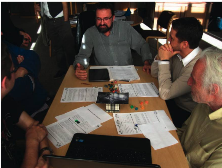
Partie de jeu de rôle à la Bibliothèque de la ville de La Chaux-de-Fonds dans le cadre d'une animation autour du jeu La Chaux-de-Fonds 1904 .

Le JdR est un loisir discret, qui s'organise entre amis dans un cadre privé. Il est donc difficile de connaître le nombre de joueurs dans notre région. D'ailleurs, aucune étude ou recensement ne peut nous donner le moindre indice à ce sujet.